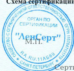
Схема сертификации За.